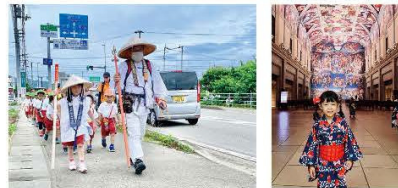
四国通路・大塚国際美術館

この土地、この街で育つ自分たちにしかできないことを考えました。徳島／四国からもらったもの、そしてこれから創っていくもの。この土地、この瞬間にしか生まれられないものを創り出します。