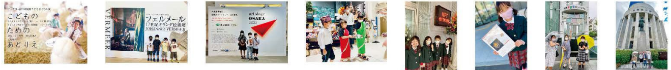
アトリエ展主催・フェルメール展見学・アートフェア見学・食料品販売職業体験・NFT鳴門美術館見学・株式購入・企業家ミュージアム見学・大阪取引所見学

芸術に触れる機会を積み重ねると共に、アートの価値（売買）についても学ぶ機会を設けてきました。