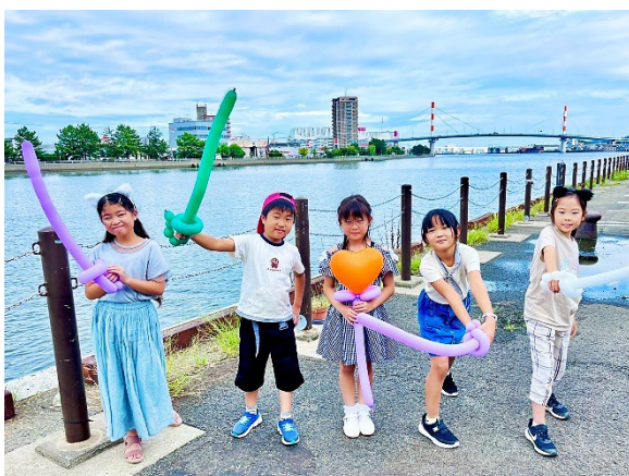
第一倉庫前のメンバー