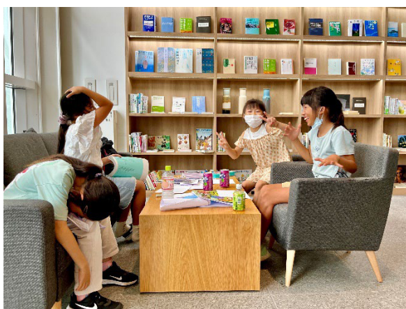
タグリバでの会議の様子