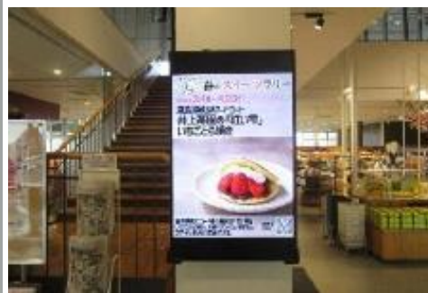
タブロイド誌「せとうちグルメ通信」（イメージ）